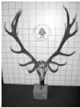
Trofeo de caza

TROFEO DE CAZA: cráneo seco o disecado de ciervos machos con astas.