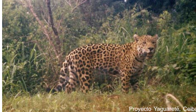
Proyecto Yaguararé, Ceiba