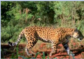
Cada individuo posee un diseño único de manchas que permite identificarlo, algo de gran utilidad para los investigadores.