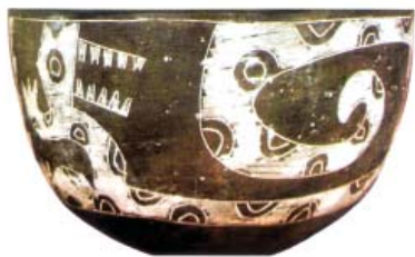
Representación del jaguar en cerámica de La Aguada, antigua cultura andina del noroeste argentino.

A su gran valor cultural se suma el ecológico: como depredador tope cumple un importantísimo rol en la comunidad que habita (especie clave). Debido a su gran necesidad territorial se asegura que si él está presente, también lo estarán especies con menores requerimientos (especie paraguas). Y además, por ser sensible a la perturbación humana es una especie indicadora de la calidad del hábitat.