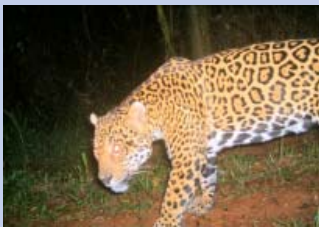
Fotos cámara trampa de ejemplares en áreas protegidas.