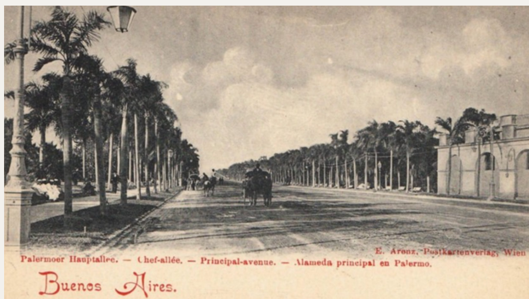
Figura 4. Galería de palmeras pindó en postal de fines del siglo XIX de la actual avenida Sarmiento, Parque 3 de Febrero. A la derecha se aprecia la casona de Juan Manuel de Rosas sin demoler aún.

Observaciones: los árboles permiten su identificación con carteles pequeños a medianos, más uno grande que presente la temática.