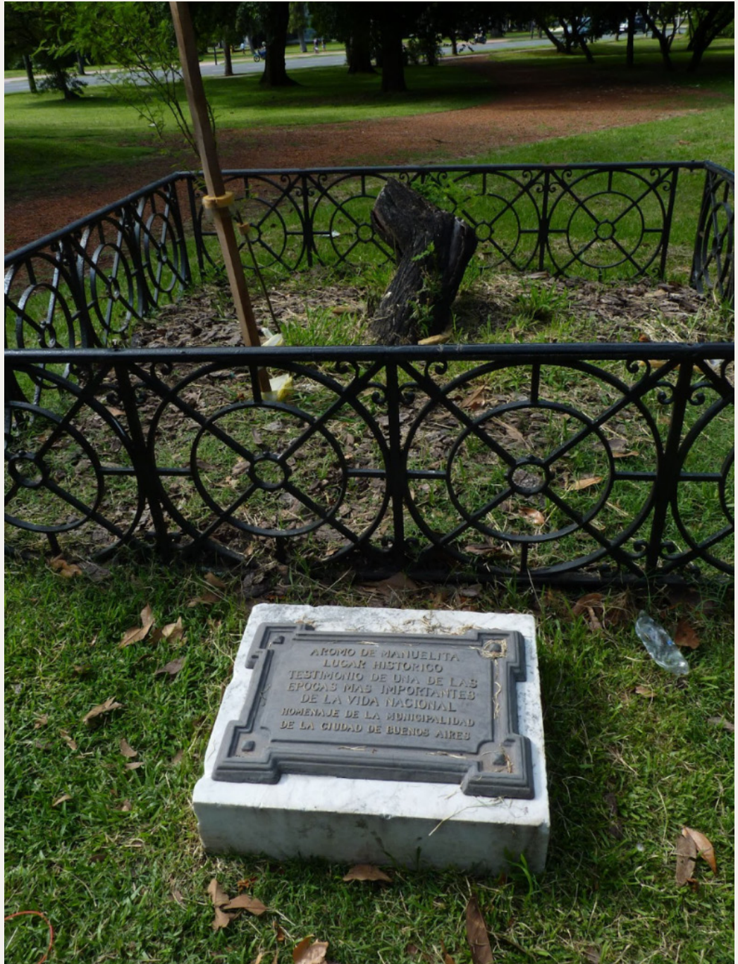
Figura 3b. Cartel del aromo del perdón en 2019 donde se aprecia el ejemplar muerto por un incendio el año anterior.

Hacia finales del siglo XIX se instaló una doble hilera de palmeras pindó sobre la actual avenida Sarmiento (ver Figura 4). Durante el siglo XX se fueron reemplazando por jacarandás y algunas palmeras pindó. La galería de palmeras fue documentada en postales de la época.