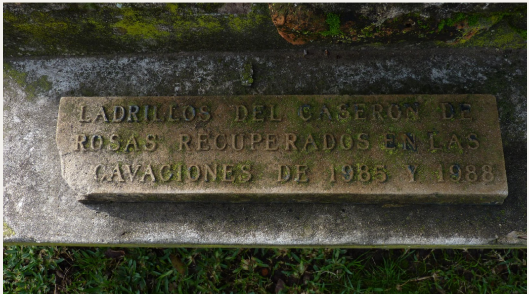
Figura 2. Ladrillos del Caserón de Juan Manuel de Rosas en la actual Plaza Sicilia, Parque 3 de Febrero, obtenidos durante la excavación arqueológica realizada en la década de 1980.