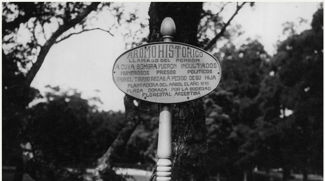
Figura 3a. Cartel del aromo del perdón en 1931, Plaza Sicilia.

El único árbol señalado en Plaza Sicilia es el “aromo del perdón”, perteneciente a una especie nativa: el aromito ( Vachellia caven ) (ver Figura 3). El ejemplar histórico fue plantado en 1845 por Manuelita Rosas, la hija de Juan Manuel de Rosas, y a su sombra ella pedía el indulto de su padre a los condenados. Hacia la década de 1970 el ejemplar murió y fue reemplazado por un aromo australiano por error (José María Menini, com. pers.). Luego se plantó uno nativo que fue incendiado en 2018 y repuesto al año siguiente.